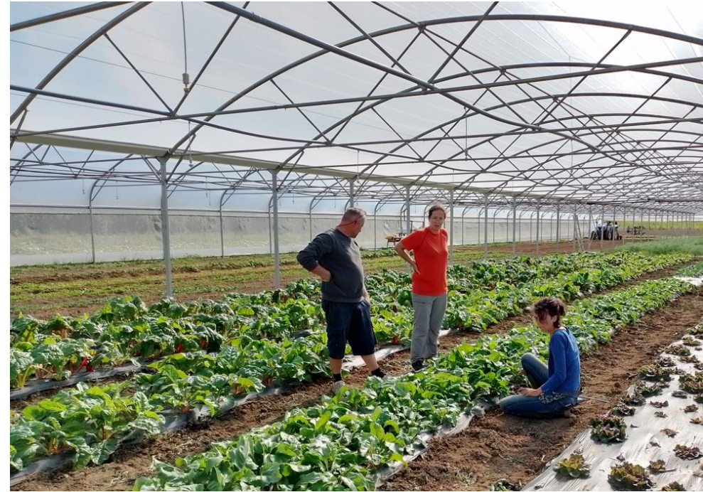
Nouvelle serre de 1.440 m 2