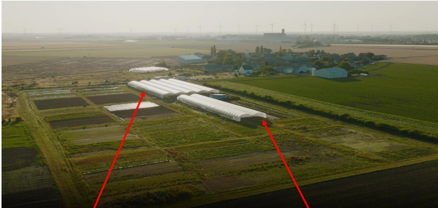
Serre initiale de 3.600 m 2